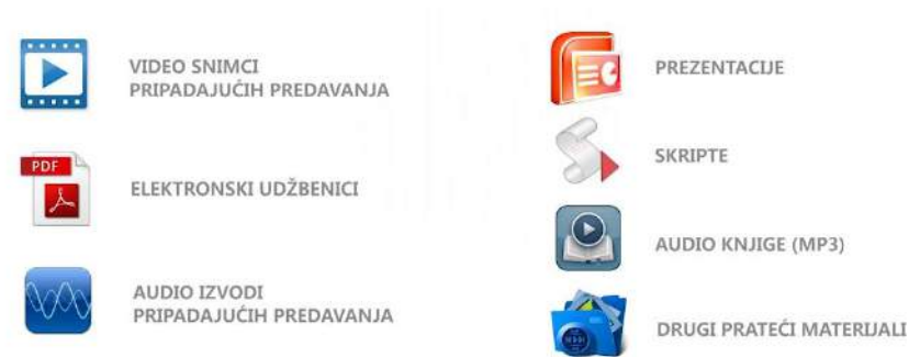
Slika 3. Zaštićeni resursi Sistema

Pristup zaključanim resursima Learning Cubes 4.0 sistema učenja na daljinu nije uključen u osnovnu cijenu školarine, već se naplaćuje zasebno zbog troškova po osnovu autorskih prava akademskom osoblju. Punom aktivacijom naloga omogućuje se pristup zaključanim resursima prikazanim na sljedećoj slici.