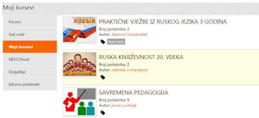
Slika 4. Lista dodijeljenih predmeta

Strogo važi pravilo: “Jedan nalog - Jedan korisnik!“ Svaki student s punim pravom pristupa zaštićenim resursima, dobija automatski pripadajuće obavezne predmete prema godini studija i smjeru. Tu funkcionalnost omogućuje veza sa glavnim informacionim sistemom e-Faculty iz kojeg Learning Cubes 4.0 iščitava podatke o pravu i nivou pristupa, te godini studija i smjeru, na osnovu kojih se studentu automatski dodjeljuju predmeti predviđeni nastavnim planom i programom.